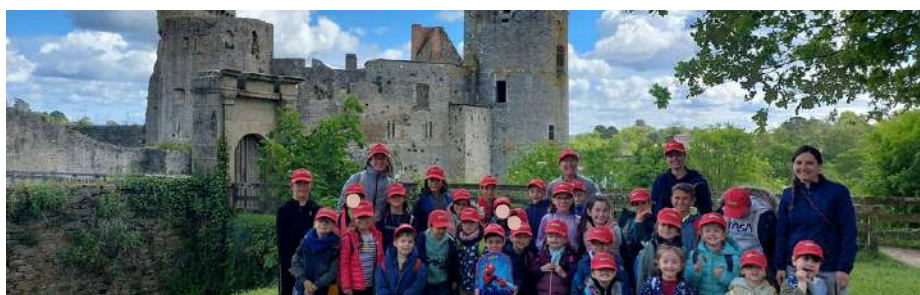
PAGE 3 | SORTIE À CLISSON