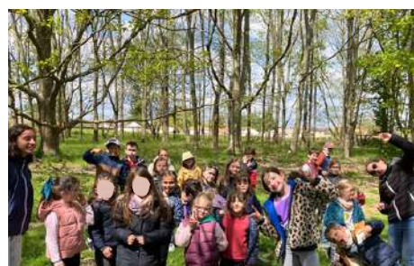
PAGE 3 | JOURNÉE AU PLAN D'EAU