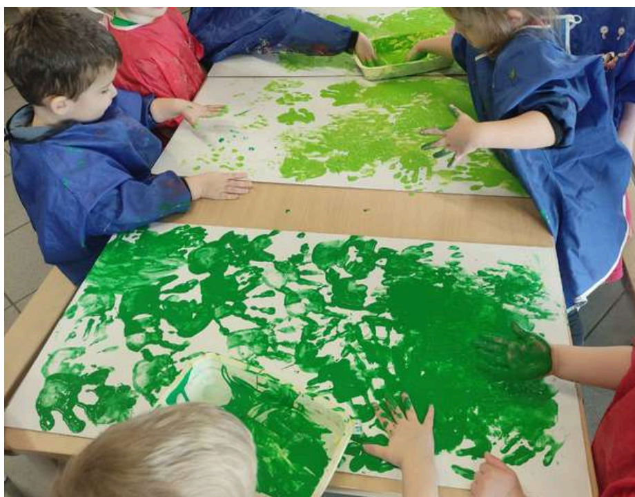
PAGE 2 | VERT, C'EST VERT, TOUT L'UNIVERS EST VERT